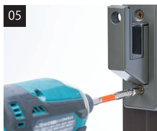
レバー受けを取り付けます