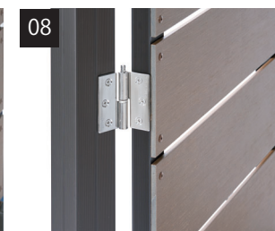
必要に応じてストッパーリングを取り付けて完成です（任意）