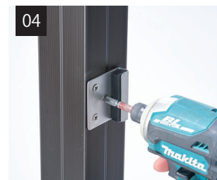
柱に戸当りを取り付けます