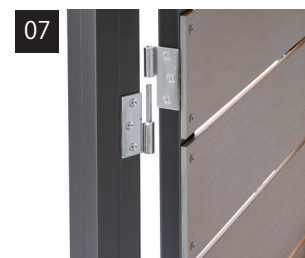
扉本体を取り付けます