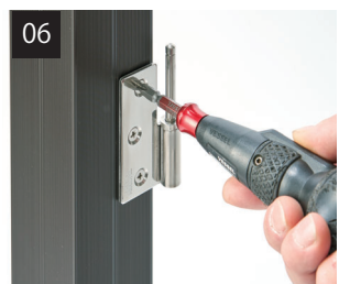
吊元柱に丁番を取り付けます