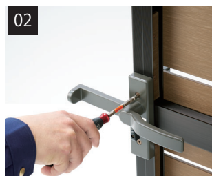
レバーハンドルのネジを締めます